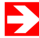
Direzione da seguire per le attrezzature